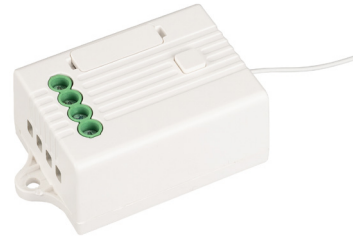
РЕЛЕЙНЫЙ МОДУЛЬ TUYA-701-WF-SUF Арт. 036221