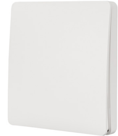
ПАНЕЛЬ TUYA-228-1-RF-SUF Арт. 033667