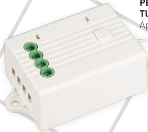
РЕЛЕЙНЫЙ МОДУЛЬ TUYA-701-WF-SUF (230V, 5A) Арт. 036221